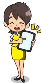
イメージキャラクター KOSEKI ちゃん